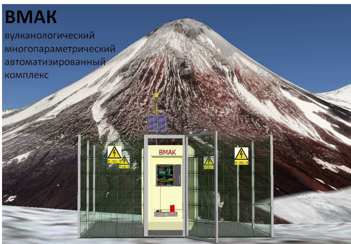
Рис. 1. Макет Вулканологического многопараметрического автоматизированного комплекса (ВМАК).

Все оборудование должно быть соединено в общую систему сбора, первичной обработки и передачи данных в приемно-аналитический центр Института вулканологии и сейсмологии ДВО РАН. В зависимости от пространственного расположения комплекса определяется наилучший вариант передачи данных, который может быть представлен в виде Wi-Fi или спутникового соединения.